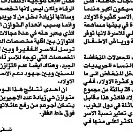
داني وويششتاين (مارس) 1997/3/3

عدة مقالات نشرت مؤخرا في صفحات الجريدة «مؤرخا» (26/12، 1/12، 1/12) طرح استون وويششتاين الادعاء بانعقاد اجتماعات اللجنة الدولية لجمعية اسر المسنين والمعاقين في القدس، وذلك لان الفلسطينيين الذين ثوروا مؤسسا الخيرية الوطني هي مستشفيات مملوكة وغير صحيحة بدرجة كبيرة.